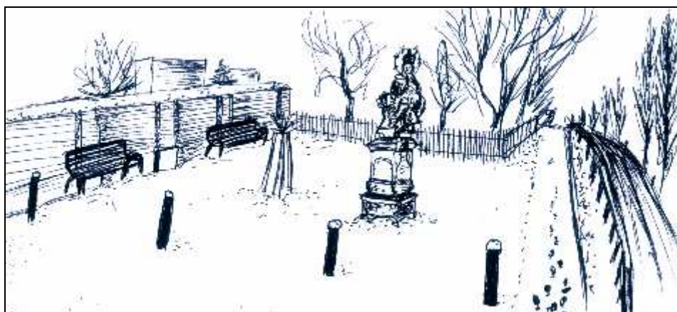
Nová úprava prostranství před hřbitovem ve Vojicích, kresba: V. Suchomelová