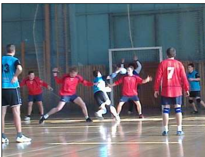
Fotografie z utkání Podhorní Újezd - Draken Brno