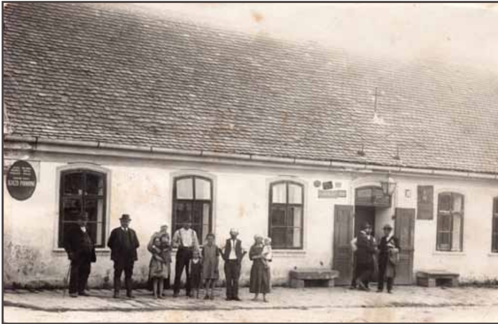
Hospoda Na Brdíku v roce 1939, rodina Slámová