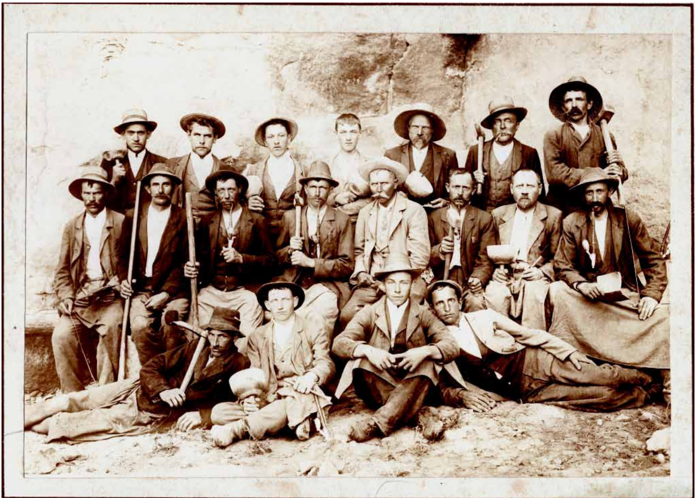
Parta kameníků, konec 19. století

informační bulletin vydává obec PODHORNÍ ÚJEZD A VOJICE