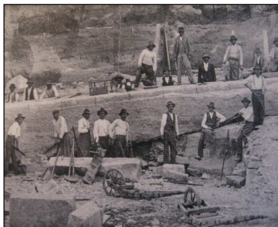
Monolit na Riegrův obelisk ještě ležící u mateřské stěny lomu v Podhorním Újezdě v roce 1903.