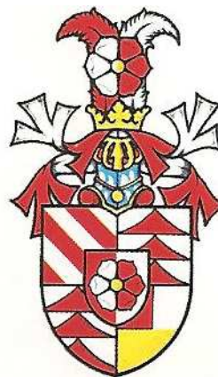
Erb rodu Trautmannsdorfů z roku 1563

Příště - První republika, Autor: Marek Šorm