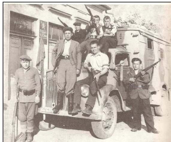
Partyzáni ve Vojicích před hostincem U Čermáků.