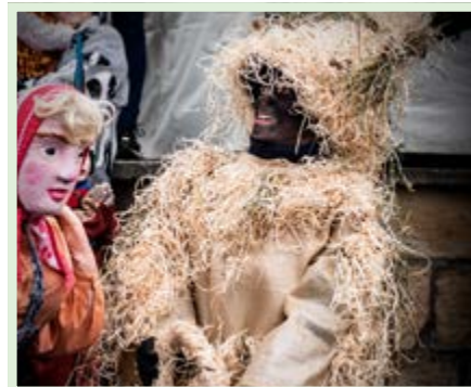
Slaměný jako symbol letošní dobré úrody se nakonec stal nejlepším maskou průvodu.