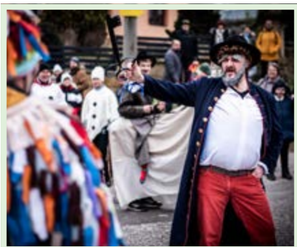
Masopustní průvod se směl vydat na cestu vesnicí až poté, co k tomu laftr získal od rychtáře svolení a symbolický klíč.