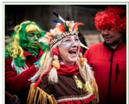
Veselí bylo všeobecné a taky nakažlivé. Čirá radost se dala číst z tváří všech masek.