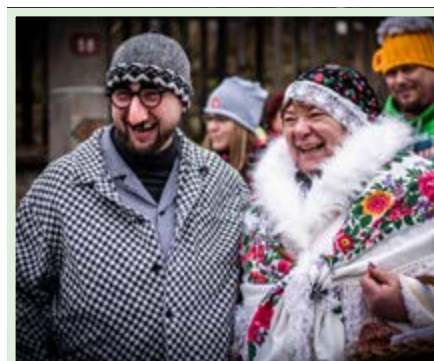
Že by se už mistr řezník zvesela připravoval na porážku masopustní kobyly?