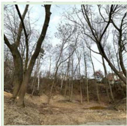
Strž ve Vojicích opravdu prokoukla. A je to jen první krok k její nové podobě.

Všichni obyvatelé Podhorního Újezdu a Vojic jsou srdečně zváni.