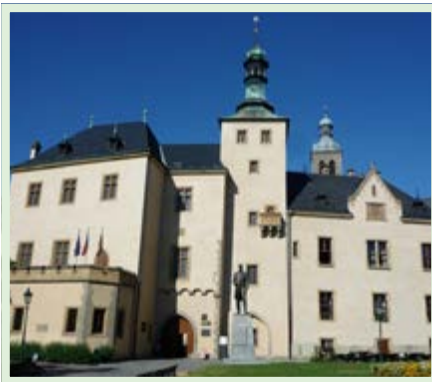
Vlašský dvůr s historií doloženou ve 13. století býval královskou mincovnou. Ražba grošíků tu dnes patří k atrakcím.

Naši senioři by si však podle mínění zastupitelů měli užívat hlavně radost ze života. Proto pro ně Obec připravuje 22. června výlet výlet do Kutné Hory.