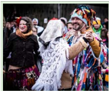
Nebylo to ale jen tak. Nejprve musel při tanci s rychtářkou dokázat, že se bude od i další maškary v kole pěkně otáčet.