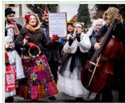
Muzikanti spustili z vesela hned od začátku a do skoku hráli nejen tradiční masopustní a lidové písničky, ale i ty současné.