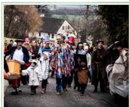
Svížné tempo udával rychtář fortelnými ranami na buben i cestou na Paříkáč.