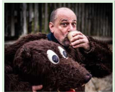
A že by o hlavu přišel i medvěd? Ne, jeho hlava musela dolů jen kvůli občerstvení.