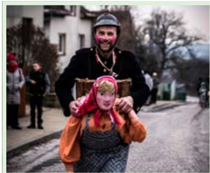
Povedená maska i hádanka. Nese bába v nůši hasiče a nebo hasič bábu s nůši?