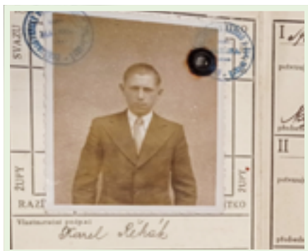
První průkazka jednoho z členů oddílu Podhorního Újezdu z roku 1937.

Druhého vrcholu dosáhla házená v roce 1964, kdy muži zvítězili v krajském přeboru a postoupili do druhé ligy. (Pokračování v příštím čísle zpravodaje)