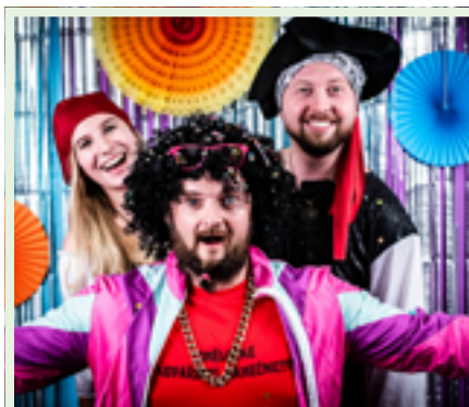
Dobře se bavili i organizátoři.