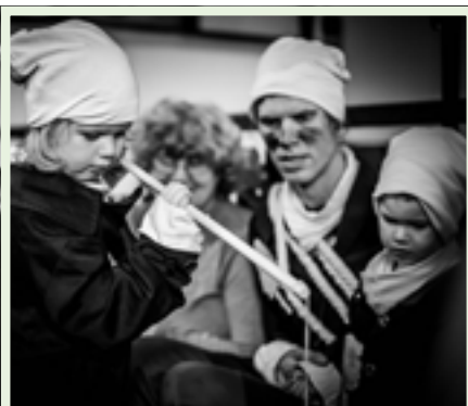
Kominíci rozdávali štěstí ve velkém.

Ovšem i při dalších soutěžích bylo v sále hodně veselo. Třeba když měly dvojice při tanci co nejdéle udržet mezi svými čely plastový míček.