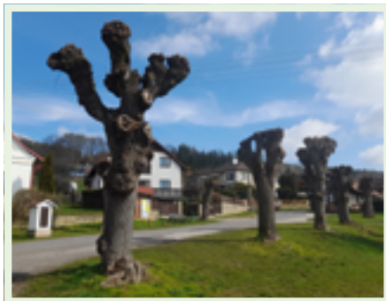
Lípy na návsi ve Vojicích prokoukly.

„Ovocné sady, především třešňové, u nás začal ve velkém zakládat řád valdických kartuziánů, kteří se těšili přízni Albrechta z Valdštejna. Díky němu také získali zdejší statky a pozemky. Mimochodem právě do krypty valdického kláštera byly svého