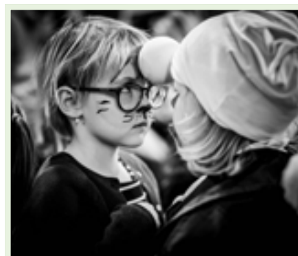
Tanec s míčky chtěl velké soustředění.