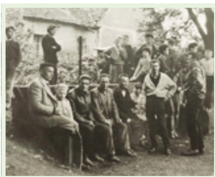
Přes velkou počáteční nedůvěru si házená postupně získala řadu příznivců.