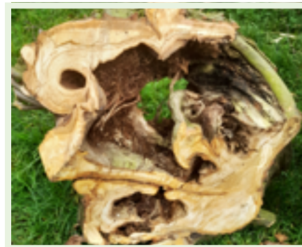
Děravá byla i většina koruny stromu.

Bylo prý opravdu velké štěstí, že strom už dávno nespádl a někoho nezranil. O "čestnou stáž" vedle pomníku se teď jistě postarají dvě podstatně mladší lípy. I jim sice v minulosti někdo dost ublížil, ale po odborném řezu mají šanci na dlouhý život. Tím spíš, že na jejich růst bude teď pravidelně dohlížet odborník.