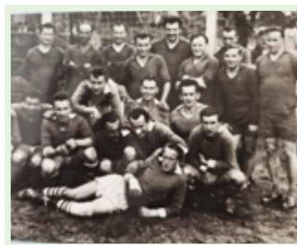
Silné družstvo mužů, nositelů tradice národní házené v naší obci.