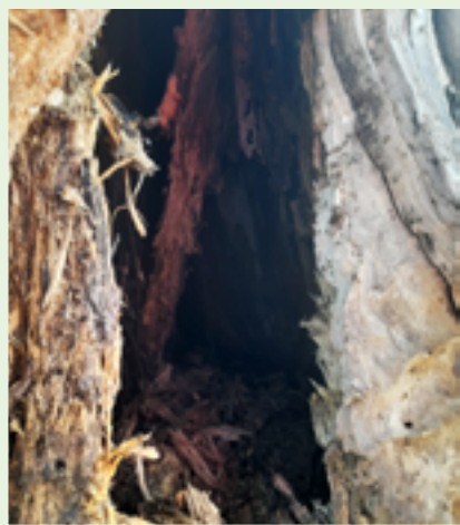
Místo kmene byla u země jen díra.

Poté, co absolvoval výstup do křehké koruny, začal postupně odřezávat jednotlivé větve. Bylo totiž třeba co možná nejvíc snížit objem i váhu horních partií stromu. A vše dělat víc než šetrně. Neustále hrozilo nebezpečí, že se kmen u země rozpadne. Skořápka, která jej držela pohromadě, byla místy třeba jen tři centimetry silná. Arborista přiznal, že čím se dostával níž, tím větší měl obavy. „Byl jsem vděčný za každou zdárně odřezanou část stromu,