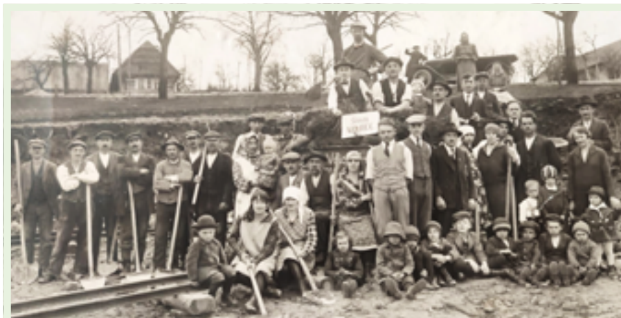
Stavba cvičiště ve Vojicích na svahu Maxince, nedaleko nad Husovým pomníkem, která započala v roce 1927 a byla ukončena v červnu 1935. O vybudování hřiště se zasloužili členové místních spolků a Sokola.