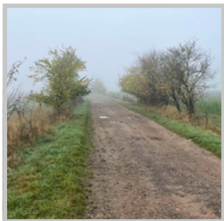
Tato polní cesta v Kabátech je už vlastně minulostí. Musí ustoupit dálnici.

Podrobné informace o budoucí dálnici D35 najdete na webových stránkách www.dalnice-d35.cz