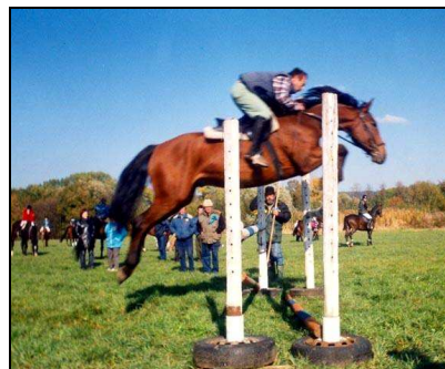
Ilustrační foto z Jezdeckého klubu