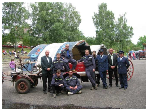
SDH Vojice s hasičskou stříkačkou Stratílek na oslavách 120. Let HS ve Vojicích.