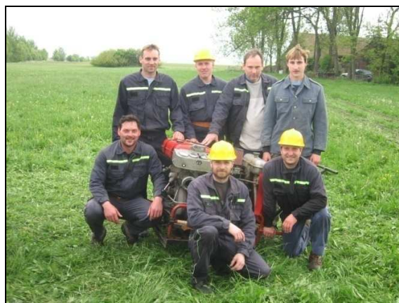
SDH Vojice na soutěži ve Třtěnicích